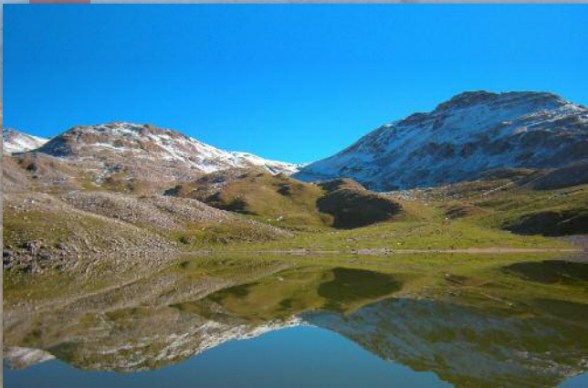
Lago della Duchessa